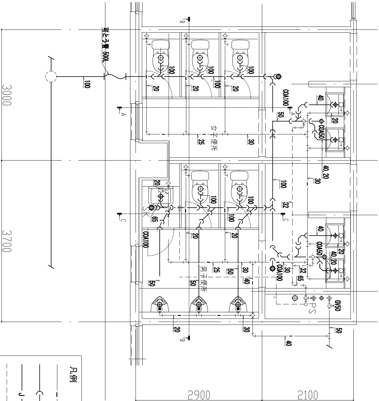
1階女子便所・男子便所詳細図 (手動給水方式) S=No Scale